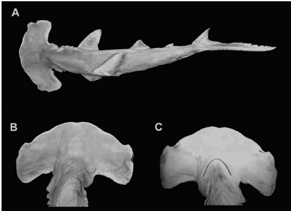
Figura 2. Ejemplar macho del tiburón martillo ojichico, INVEMAR PEC 7058, 506 mm LT, El Roto, Golfo de Urabá, Caribe colombiano. A. Vista dorsal del cuerpo completo. B. Vista dorsal de la cabeza. C. Vista ventral de la cabeza.

Morfometría: LT: 506 mm; longitud rostro a la narina: 23 mm; ancho narina: 10.9 mm; distancia internarinas: 106.6 mm; longitud pliegue nasal anterior: 3.7 mm; diámetro horizontal del ojo: 10.7 mm; diámetro vertical del ojo: 13.2 mm; longitud rostro al ojo: 33 mm; distancia interorbital: 138.7 mm; longitud rostro a la boca: 35.9 mm; longitud boca: 18.4 mm; ancho boca: 33.5 mm; longitud prebranquial: 79 mm; distancia interbranquial: 30.0 mm; longitud abertura branquial 1 (ab1): 13.8 mm; longitud ab2: 15.8 mm; longitud ab3: 14.8 mm; longitud ab4: 14.7 mm; longitud ab5: 14.3 mm; longitud cabeza: 109 mm; altura cabeza: 44.7 mm; ancho cabeza: 45.3 mm; longitud prepectoral: 107 mm; longitud margen anterior pectoral: 62.6 mm; longitud base pectoral: 25.9 mm; longitud margen interno pectoral: 25.0 mm; longitud pectoral: 57.1 mm; altura cuerpo: 51.9 mm; ancho cuerpo: 41.1 mm; longitud preprimera aleta dorsal: 138 mm; longitud base total primera dorsal: 69.1 mm; longitud margen anterior primera dorsal: 76.7 mm; longitud base primera dorsal: 46.9 mm; altura primera dorsal: 59.8 mm; longitud margen interno primera dorsal: 21.5 mm; longitud margen posterior primera dorsal: 62.6 mm; altura cuerpo nivel abdomen: 51.8 mm; ancho cuerpo nivel abdomen: 35.0 mm; distancia entre pectoral y pélvica: 87.7 mm; distancia entre mitad primera dorsal y pélvica: 55.7 mm; longitud prepélvica: 217 mm; longitud base total pélvica: 41.3 mm; longitud margen