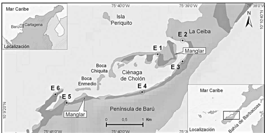
Figura 1. Ciénaga de Cholón donde se indican las estaciones de muestreo. Se destacan las áreas de manglar.