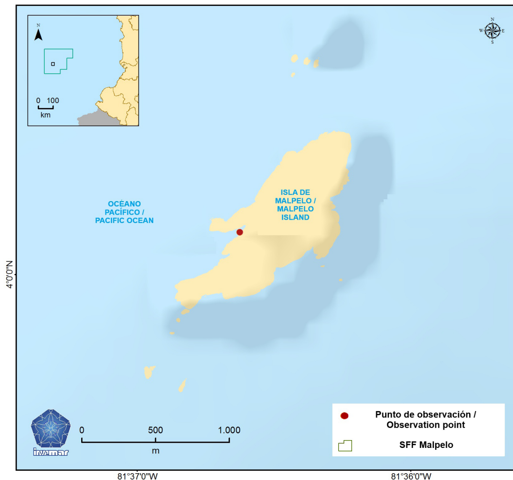
Figura 1. Mapa del SFF Malpelo donde se indica el punto de observación de la colonia

associated with shallow coral communities and marginal reefs. They have been recorded in localities of the Equatorial Eastern Pacific, including Costa Rica, Panama, and the Galapagos archipelago, where they are part of coral assemblages dominated mainly by pocilloporids (Glynn et al. , 2017). Psammocora stellata is usually found forming encrusting or submassive colonies on rocky and reef substrates, while P. profundacella is common in reef environments and consolidated bottoms, presenting a bathymetric distribution that can extend from shallow zones to moderate depths. Taking this into account, this work presents for the first time the presence of the genus Psammocora in the Malpelo Fauna and Flora Sanctuary.