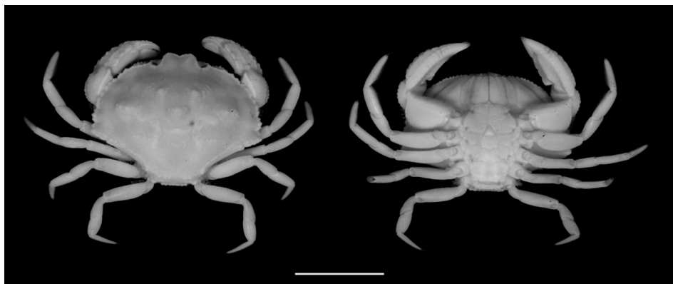
Figura 4. Ejemplar macho de Hepatus scaber en vista dorsal y ventral. Escala 1 cm. INV-CRU 5718 E 218.

Distribución: Atlántico Occidental: Venezuela, Guayanas y Brasil (de Amapá a Río de Janeiro) (Holthuis, 1959; Melo, 1996). Con una distribución batimétrica entre 9 y 85 m de profundidad (Holthuis, 1959). Los especímenes colectados en la península de la Guajira se encontraban a 10 m.