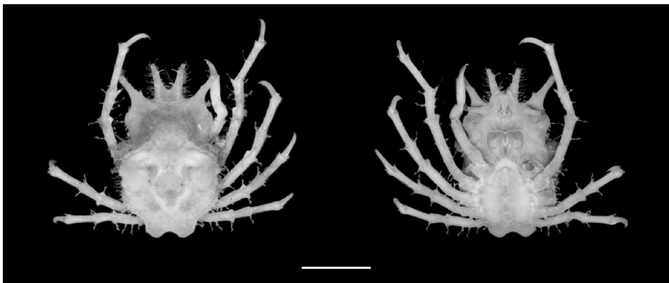
Figura 2. Ejemplar hembra de Tyche emarginata en vista dorsal y ventral. Escala 1 cm. INV-CRU 5716 E 206.

Características distintivas: Procesos preorbitales y cuernos rostrales fuertemente divergentes. Región gástrica mucho más elevada que la frontal, con tres tubérculos, dos de los cuales están situados en la parte anterior y el tercero hacia la mitad de la parte posterior. Superficie dorsal de la región hepática cóncava. Un tubérculo grande en el lóbulo branquial anterior y una cresta prominente, tuberculada en las regiones braquiales. Lóbulo cardíaco con tres tubérculos pequeños.