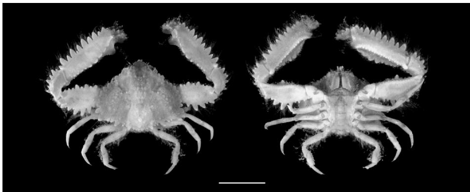
Figura 3. Ejemplar macho de Piloslambrus guerini en vista dorsal y ventral. Escala 1 cm. INV-CRU 5738 E 214

Características distintivas: Rostro corto y tridentado. Caparazón más ancho que largo. Margen antero-lateral convexo, separado del margen postero-lateral por una espina fuerte dirigida hacia fuera y atrás. Elevaciones del caparazón con tubérculos granulados de diferentes tamaños. Con una depresión profunda entre las regiones gástrica, cardíaca y branquial. Región cardíaca alta y redondeada, con tres gránulos más fuertes en hilera longitudinal. Región gástrica con cinco gránulos sobresalientes, los cuatro anteriores